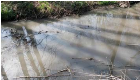
Bojovský potok po havárii na ČOV Mníšek. O pár kilometrů dál to pijí lidé ze svých studní.

stroj, ačkoli chodník na Čisovické ulici za dálnici stále chybí a je nebezpečné se na úzké komunikaci pohybovat sám, natož s kočárkem. Proto se budují hypermarkety, ačkoli se kvůli nim musí zasypat mokřad, který tu měl dlouhodobou smys-