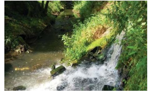
Zprava přítok z výpusti ČOV – průtok je již dnes vyšší než Bojovský potok v letním období.